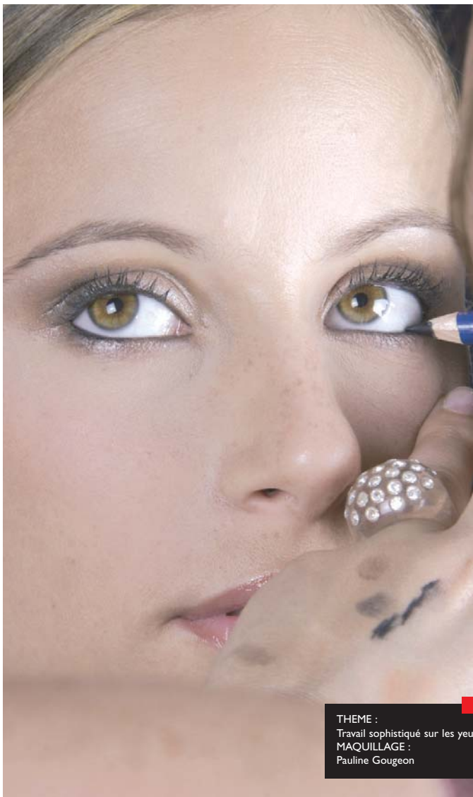
THEME : Travail sophistiqué sur les yeux MAQUILLAGE : Pauline Gougeon