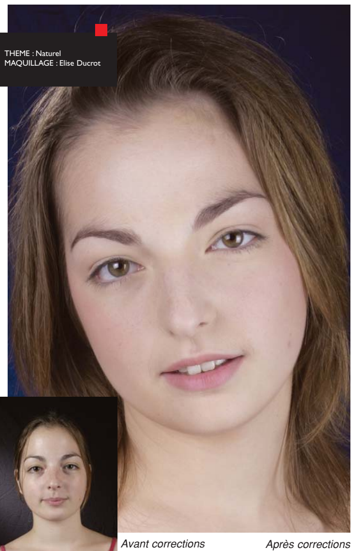
THEME : Naturel MAQUILLAGE : Elise Ducrot