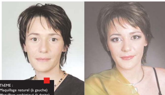
THEME : Maquillage naturel (à gauche) Maquillage sophistiqué (à droite) MAQUILLAGE : Tiffany Gilles