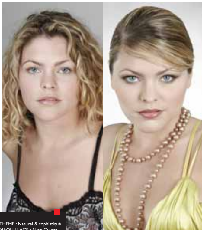
THEME : Naturel & sophistiqué MAQUILLAGE : Aline Guinet

À gauche, un maquillage de jour naturel À droite, le maquillage a été retravaillé pour le soir