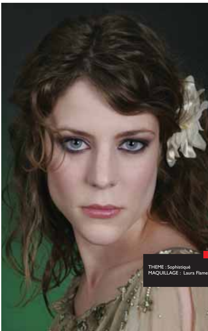
THEME : Sophistiqué MAQUILLAGE : Laura Flament