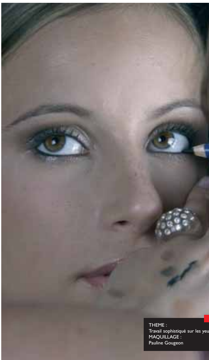
THEME : Travail sophistiqué sur les yeux MAQUILLAGE : Pauline Gougeon