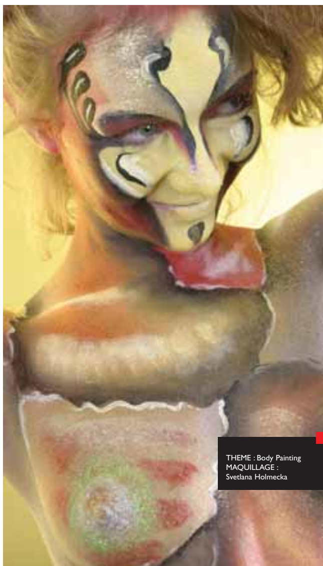
THEME : Body Painting MAQUILLAGE : Svetlana Holmecka

Venez découvrir une discipline qui révèle d'exceptionnels moments de créativité !