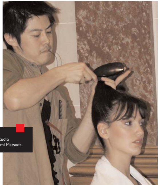
THEME : Coiffure studio COIFFURE : Masafumi Matsuda