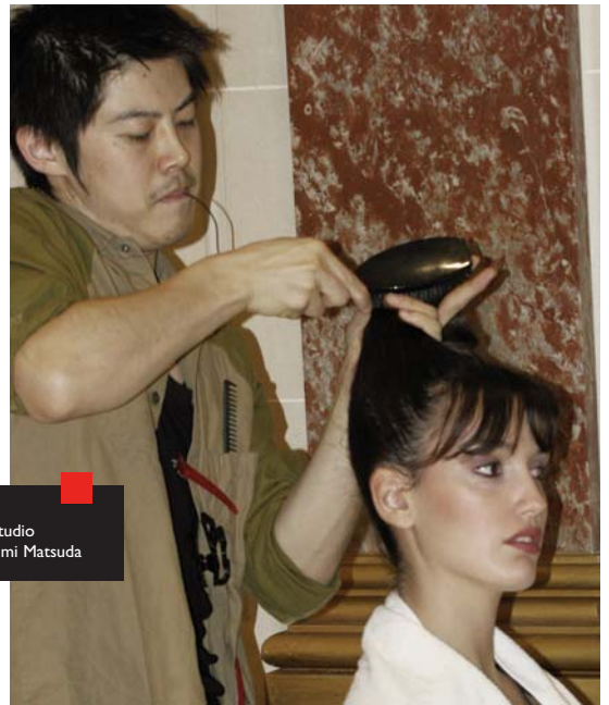
THEME : Coiffure studio COIFFURE : Masafumi Matsuda