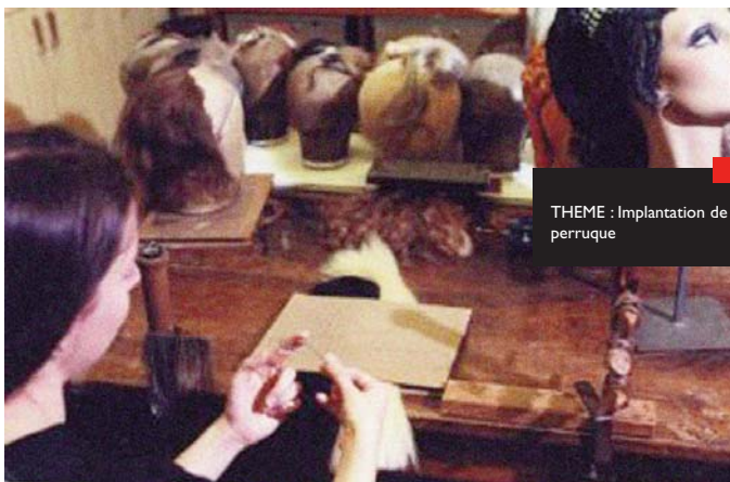
THEME : Implantation de perruque

Le matériel spécifique est mis à disposition des participants, sur place, pendant toute la durée de l'atelier.