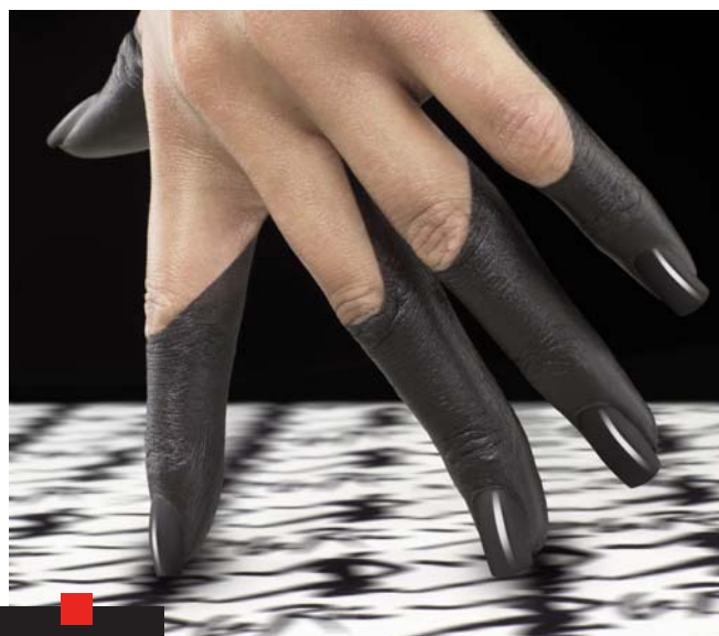
NAIL ART : La Ric