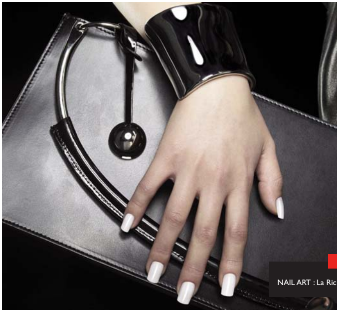
NAIL ART : La Ric