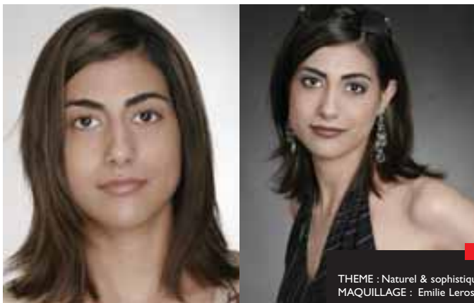
THEME : Naturel & sophistiqué MAQUILLAGE : Emilie Lerose