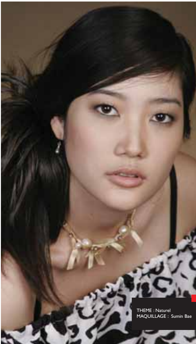
THEME : Naturel MAQUILLAGE : Sumin Bae

Venez apprendre les gestes des professionnels et faites du maquillage votre allié au quotidien !