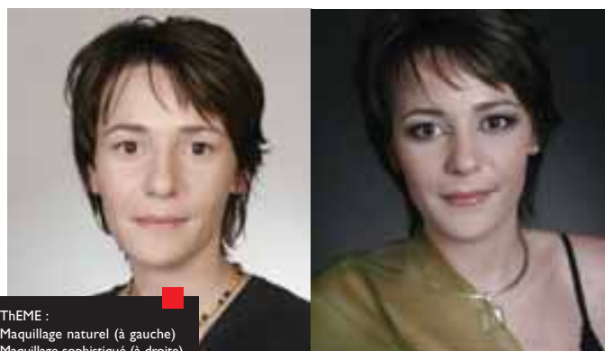
THEME : Maquillage naturel (à gauche) Maquillage sophistiqué (à droite) MAQUILLAGE : Tiffany Gilles