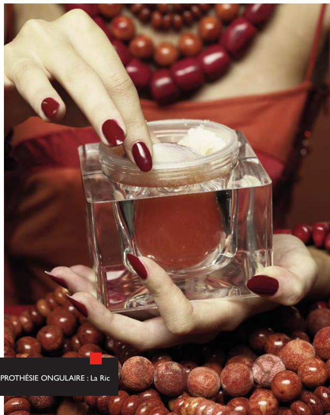
PROTHÉSIE ONGULAIRE : La Ric

Des formations sur mesure peuvent être établies sur demande. Contactez Florence CAPEL au 01 44 08 11 48