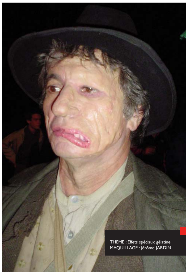
THEME : Effets spéciaux gélatine MAQUILLAGE : Jérôme JARDIN

Il y a encore peu de temps, le seul matériau disponible pour transformer un comédien était la mousse de latex, une matière opaque dont la formule n'avait pas évoluée depuis les années trente. Avec les progrès réalisés dans le domaine de la photographie et des émulsions, l'opacité du latex devint de plus en plus intolérable à l'œil. Pour retrouver la transparence de la peau, les maquilleurs se tournent vers la gélatine, une matière facile à fabriquer, et d'autres matières transparentes.