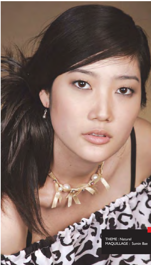
THEME : Naturel MAQUILLAGE : Sumin Bae

Venez apprendre les gestes des professionnels et faites du maquillage votre allié au quotidien !