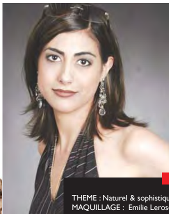
THEME : Naturel & sophistiqué MAQUILLAGE : Emilie Lerose