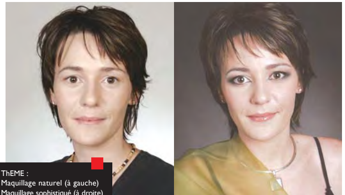
THEME : Maquillage naturel (à gauche) Maquillage sophistiqué (à droite) MAQUILLAGE : Tiffany Gilles