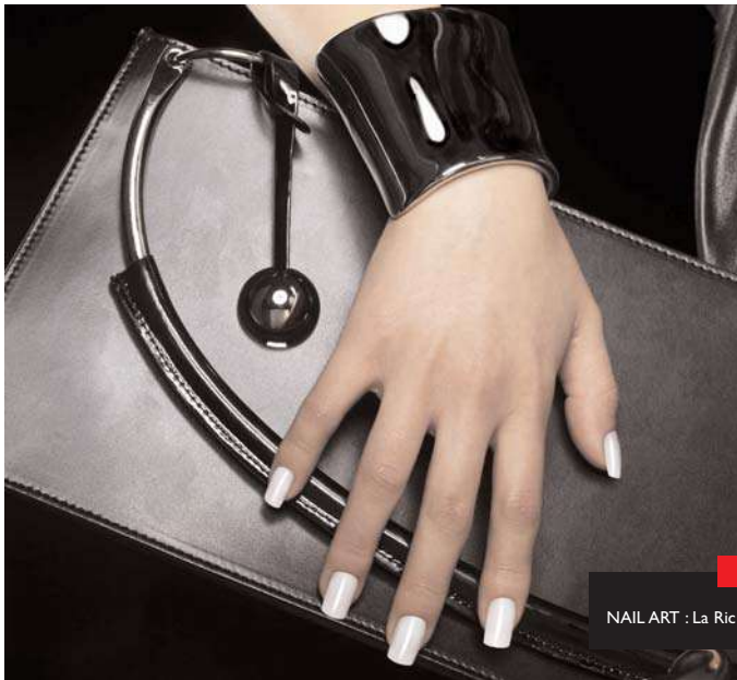
NAIL ART : La Ric