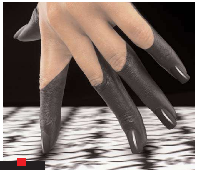
NAIL ART : La Ric