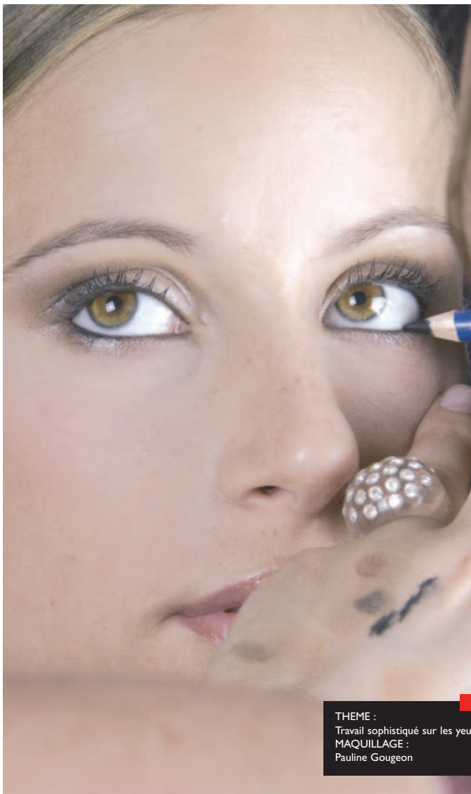
THEME : Travail sophistiqué sur les yeux MAQUILLAGE : Pauline Gougeon