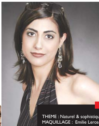
THEME : Naturel & sophistiqué MAQUILLAGE : Emilie Lerose