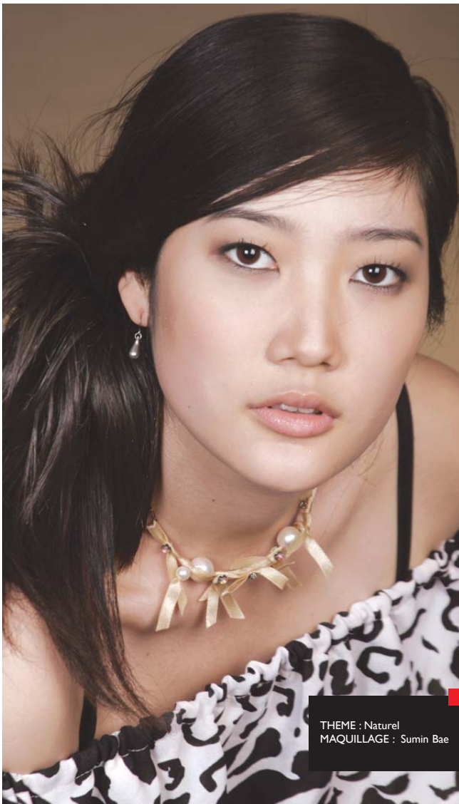
THEME : Naturel MAQUILLAGE : Sumin Bae

Venez apprendre les gestes des professionnels et faites du maquillage votre allié au quotidien !