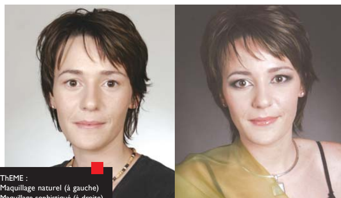
THEME : Maquillage naturel (à gauche) Maquillage sophistiqué (à droite) MAQUILLAGE : Tiffany Gilles