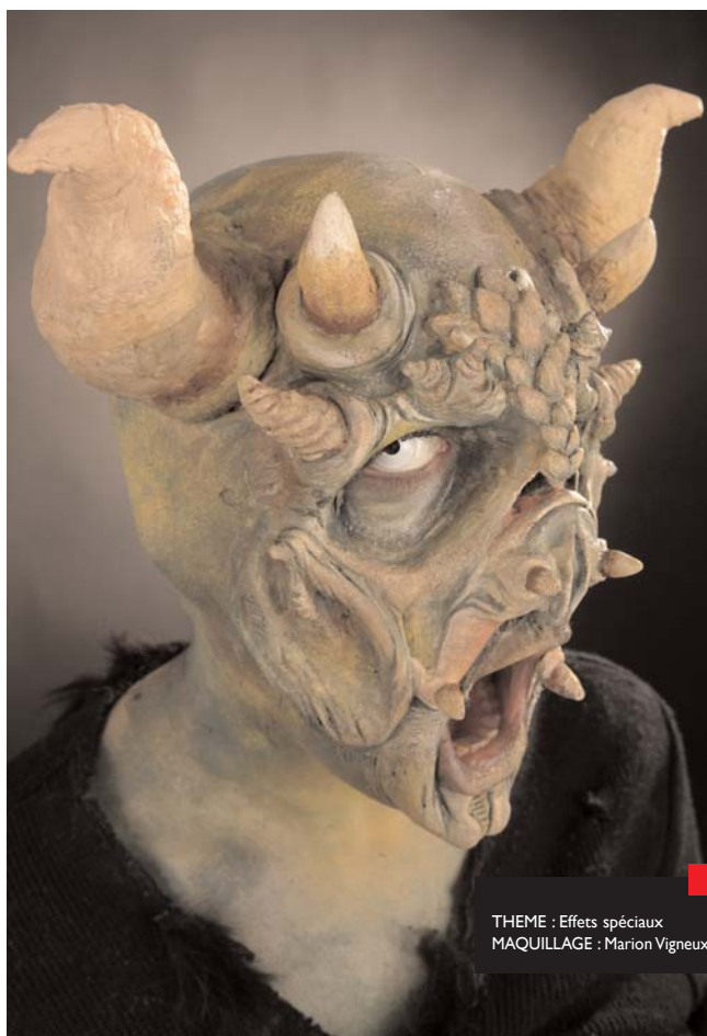
THEME : Effets spéciaux MAQUILLAGE : Marion Vigneux

Parfois, c'est aussi lui qui a conçu et fabriqué les prothèses. On parle alors de maquilleur-prothésiste. Mais, le plus souvent, c'est un atelier spécialisé qui les réalise. Dans ce cas, le maquilleur intervient avec le réalisateur pour la mise au point des personnages, puis pour sa mise en oeuvre. Il n'est pas rare que celle-ci dure plusieurs heures, pour finalement tourner quelques minutes. Les effets spéciaux avec pose de prothèses constituent un savoir-faire particulier, exigeant et créatif. C'est un métier dans le métier.